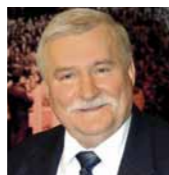
Lech Walesa (født 1943)

Tidligere strejkeleder, præsident og formand for Solidarnosc. Fik Nobels fredspris i 1983.