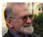
Bronislaw Geremek (1932-2008)

Første premierminister efter kommunismens fald. Politiker, redaktør og rådgiver for Solidarnosc.