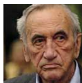
Tadeusz Mazowiecki (født 1927)

Tidligere strejkeleder, præsident og formand for Solidarnosc. Fik Nobels fredspris i 1983.