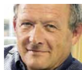
Adam Michnik (født 1946)

Forfatter og politiker. Rådgiver for Solidarnosc og Lech Walesa.