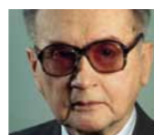
Wojciech Jaruzelski (født 1923)

Journalist, redaktør og medstifter af Solidarnosc.