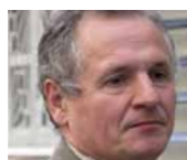
Zbigniew Bujak (født 1954)

Redaktør, politiker, medstifter af KOR og deltager i rundbordssamtalerne.