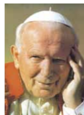
Pave John Paul II (1920-2005)

Polsk general, præsident og sidste regeringschef under kommunismen.